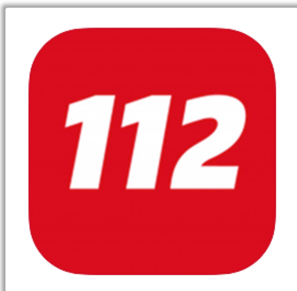
Installeer de app nu als je hem nog niet hebt!!!!!!

HIJ IS SIMPEL IN GEBRUIK EN DE HULPDIENTEN VINDEN JE ALTIJD OMDAT ZE BIJ GEBRUIK STEEDS DE JUISTE PLAATSBEPALING DOORKRIJGEN