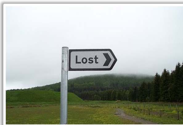
Noodhulp nodig en wat nu?

DIT KAN JOU NIET ALLEEN OVERKOMEN OP EEN WANDELING MAAR OOK IN JE DAGELIJKSE LEVEN EN IN EEN BOSRIJKE OMGEVING OF EEN NIET ZO GOED GEKENDE BUURT IS HET NIET ZO EVIDENT OM DE JUISTE PLAATSBEPALING DOOR TE GEVEN AAN DE HULPDIENTEN